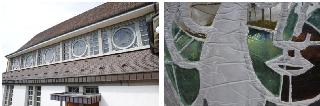
Fig. 1. Église Saint-Germain-d'Auxerre à Courfaivre, a) vue extérieure de la façade sud avec médaillons en dalle de verre, Fernand Léger, 1954 ; b) détail de la face externe du médaillon de l'Annonciation.

Le cycle de Fernand Léger a été conçu pour les nouveaux collatéraux en béton armé de l'église de Courfaivre construits par l'architecte jurassienne Jeanne Bueche en 1954. 8 Il se compose de dix médaillons encadrés de panneaux rectangulaires dans les fenêtres hautes de la nef et de deux vitraux en arc en plein-cintre dans le chœur. Cet ensemble figuratif est complété par des dalles de verre abstraites décorant les bas-côtés de l'église (fig. 1a). Le programme iconographique du cycle a été établi par l'architecte et le curé de l'église et élaboré en étroite collaboration avec l'artiste. La réalisation des dalles de verre est confiée à l'atelier de verriers Aubert et Pitteloud de Lausanne. Les médaillons ont un diamètre de 1,61 m ; ils sont tenus par un cadre rond métallique avec un profil en forme de « L » vissé dans la structure en béton armé. Les deux grands vitraux dans le chœur mesurent 3,06 m de haut pour 1,04 m de large. Ils sont montés avec un mortier de pose dans la feuillure de la baie depuis l'intérieur et scellés avec un mortier de pose. Les médaillons comme les grands vitraux dans les baies du chœur ont été moulés en une pièce. La face externe du panneau correspond à la face inférieure de la dalle de verre lors du moulage. Elle est lisse et montre des « marques de plis » suggérant que le panneau a été coulé sur des draps (fig. 1b). La face interne du panneau correspond à la face supérieure de la dalle de verre ; elle est légèrement rugueuse.