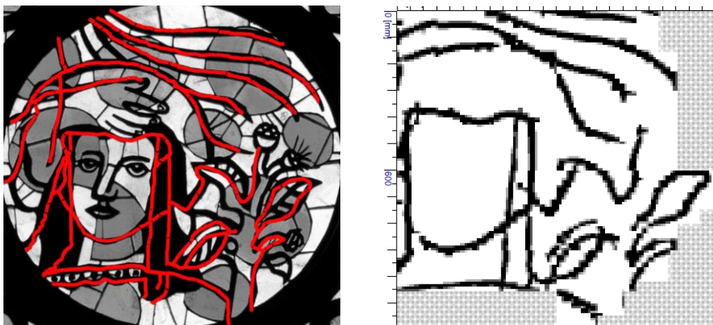
Fig. 3. Position des armatures dans le médaillon de l'Annonciation à Courfaivre déterminée avec un aimant (à gauche) et à l'aide d'un profomètre Hilti Ferroskan PS200 avec analyse et interprétation automatisées (à droite).

La détermination de la position des armatures est une première étape importante dans le diagnostic des dégâts, car la corrosion des armatures peut entraîner un écaillage important au béton. La position des fers peut être déterminée avec précision et un minimum d'efforts à l'aide d'un aimant puissant et d'un papier fixé sur la dalle de verre, mais seulement jusqu'à une profondeur de 15–20mm. Les mesures avec le profomètre à induction avec analyse et interprétation automatisées ainsi qu'avec un géoradar donnent également des résultats fiables (fig. 3). L'avantage des deux dernières méthodes est qu'elles permettent de déterminer non seulement la position, mais également l'épaisseur de l'enrobage des fers jusqu'à une profondeur de 100mm (voir ci-dessous) ; en outre, les mesures peuvent être enregistrées et visualisées. Cependant, l'acquisition et le traitement de données sont chronophages, et les appareils, par ailleurs coûteux, ne peuvent être utilisés que par des spécialistes.