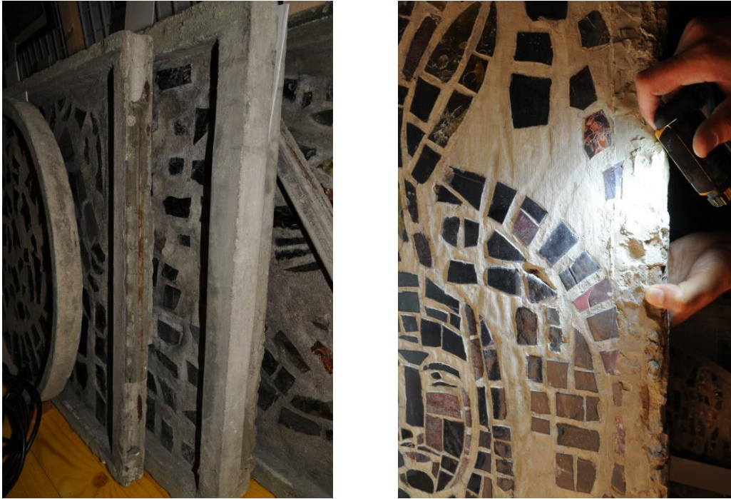
Fig. 2. Archives du couvent des Cordeliers, a) quelques panneaux du vitrail en dalle de verre déposé en 1978, Alexandre Cingria, 1938 ; b) détail de la face externe du panneau 3b en lumière réfléchie.